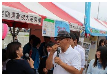
本間ちゃんも試食しました