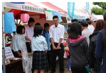
開店と同時に大忙し！