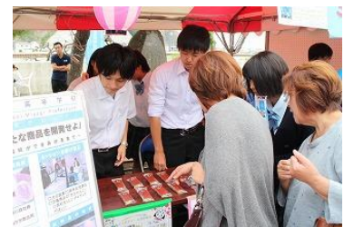
商品案内も丁寧に