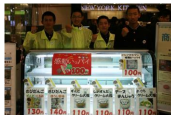
エスパル仙台店での販売実習は大盛況でした（12月）