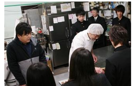
今回の工場見学の様子

商 業科目「課題研究」の商品開発講座で開発を進め、商品化が実現した『イシノマキマン感動いっパイ』。これまで、地元企業のご協力をいただいて完成までたどり着くことができました。パッケージデザインなどについて、webデザインや広告を取扱う「ビヨンド」様、製造については「洋菓子カルン」様と連携してきました。2月9日（金）には、「洋菓子カルン」様の工場を訪問させていただき、菓子が完成するまでの工程を見学しました。今回、工場を見学することで、商品の企画から製造、販売までの一連の過程を学ぶことができ、生徒には有意義な一日になりました。