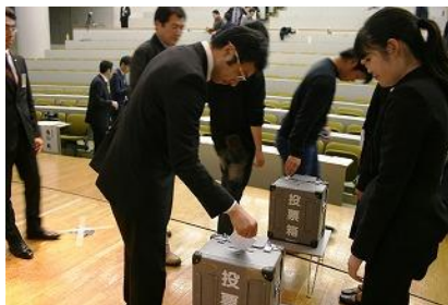
審査員と一般の方との投票 で結果が出ました