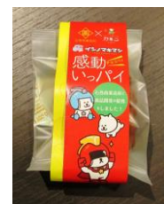
今回商品化が実現した「イシノマキマン感動いっパイ」