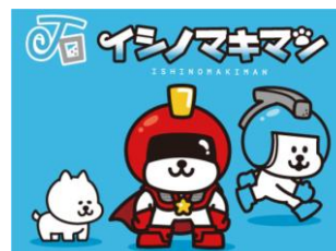
石巻活性のシンボル「イシノマキマン」