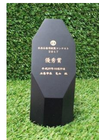
副賞として、「雄勝石」製の トロフィーが授与されました