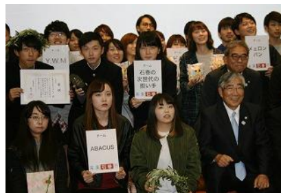
決勝大会には大学生や高校生など、 12チームが参加しました