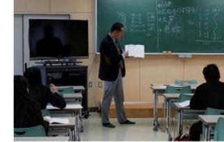
リテールマーケティング講座