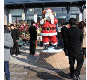
7Mパジョン総本店オープニングイベント