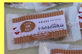
「桃次郎のきびだんご ほうじ茶味」 「とろけるクッキー黒蜜きなこ」